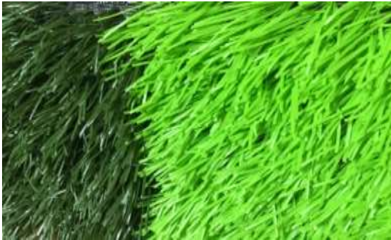
3rd generation long pile turf for soccer

5/ توريد وعمل طبقة من الرمل الحلوانى بسمك 5سم و الفرد